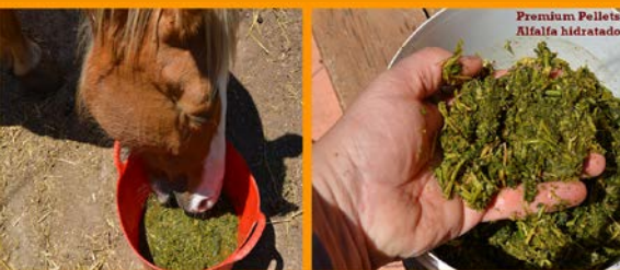
Premium Pellets Alfalfa hidratado

En Covaza te ofrecemos Premium Pellets Alfalfa , Premium Pellets Festuca y Premium Pellets Heno de avena .